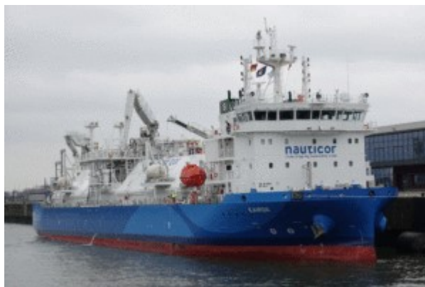
Die »Kairos« ist das größte LNG-Bunkerschiff der Welt.

Mit einer Tankkapazität von 7.500 m 3 ist die »Kairos« das größte LNG-Bunkerverschiff der Welt , sie gehört Babcock Schulte Energy. Nauticor chartert das Schiff über das Joint Venture Blue LNG, an dem Nauticor mit 90% und der litauische Energieinfrastrukturanbieter Klaipėdos Nafta mit 10% beteiligt sind.